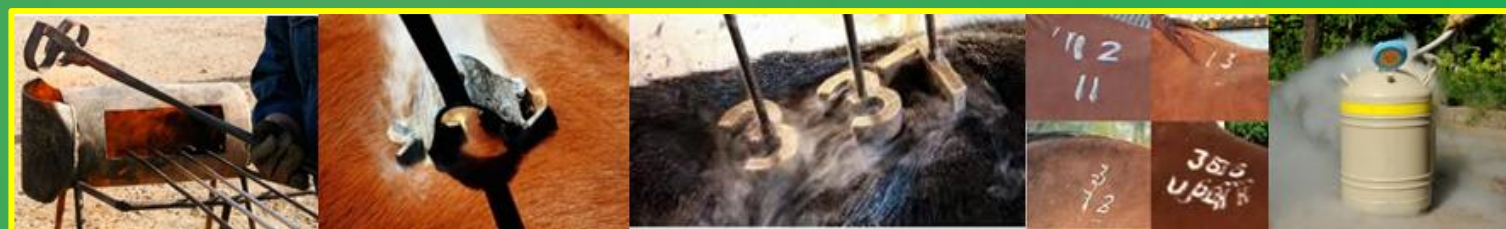
Таврирование и Көкпар