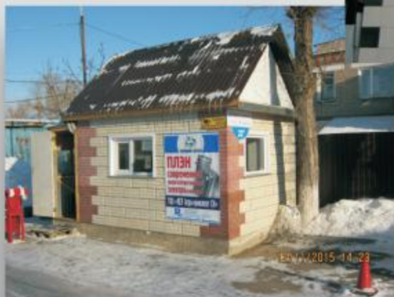
г. Петропавловск Пост охраны “Тулпар 2030”, сентябрь 2015 г.