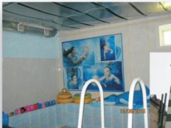
г. Петропавловск “Дом ребенка”, май 2015 г.