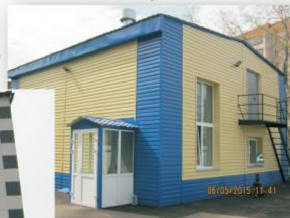
г. Петропавловск КНС “Кызылжар су”, август 2014 г.