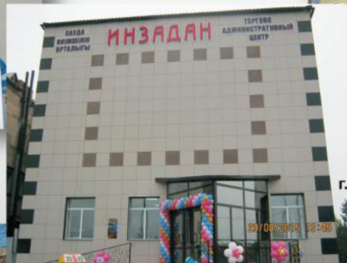
с.Саумалколь “ТД Инзадан”, ноябрь 2015 г.